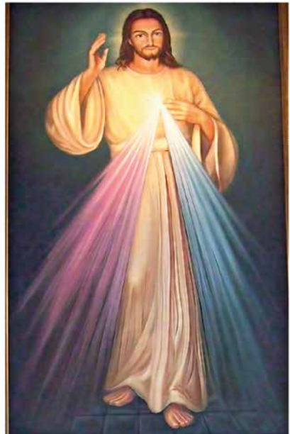
Gnadenbild vom barmherzigen Jesus

Der Barmherzigkeitssonntag (auch Sonntag der Göttlichen Barmherzigkeit) ist der erste Sonntag nach Ostern und wurde 2000 von Papst Johannes Paul II. eingeführt, basierend auf den Visionen der Heiligen Faustina Kowalska, um die unerschöpfliche göttliche Barmherzigkeit zu feiern. Dieser Tag lädt ein, das Bild des Barmherzigen Jesus zu verehren.